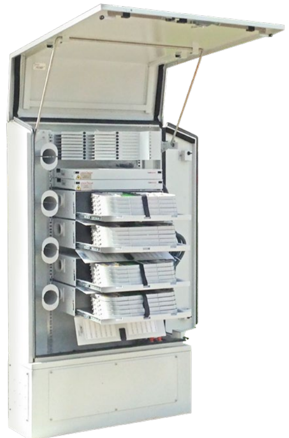
Module du port 3U 72/144