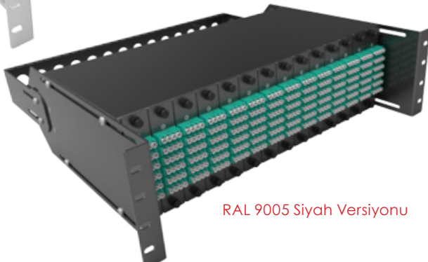
RAL 9005 Siyah Versiyonu