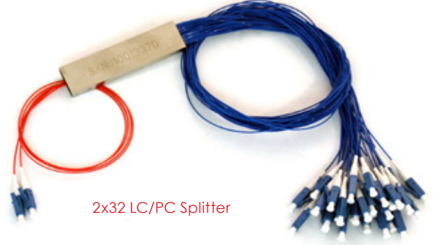
2x32 LC/PC Splitter

FTTX şebekeleri, Telekomünikasyon şebekeleri, CATV uygulamaları, Ağ izleme