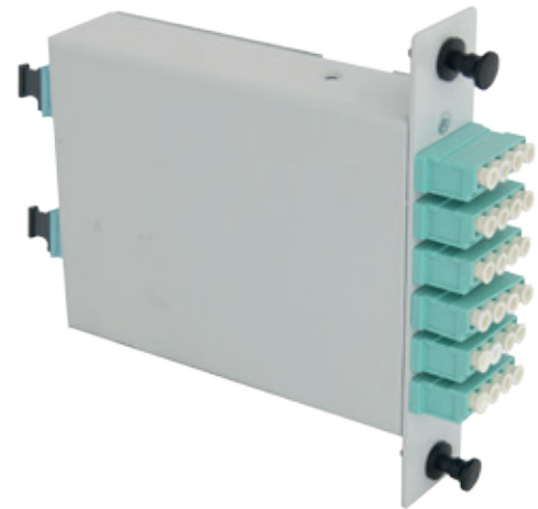
MTP® ve MPO Kaset Modülleri