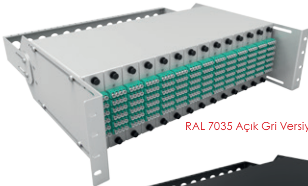
RAL 7035 Açık Gri Versiyonu