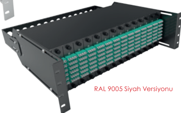
RAL 9005 Siyah Versiyonu