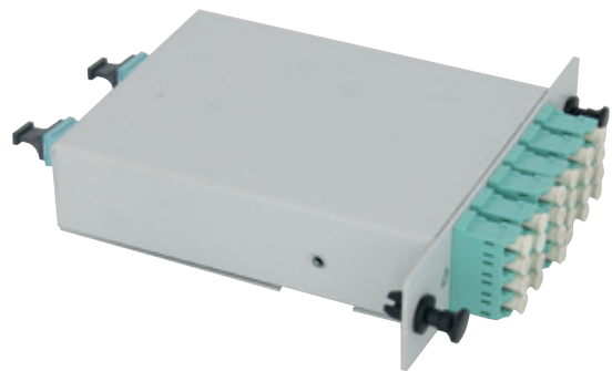
MTP® ve MPO Kaset Modülü