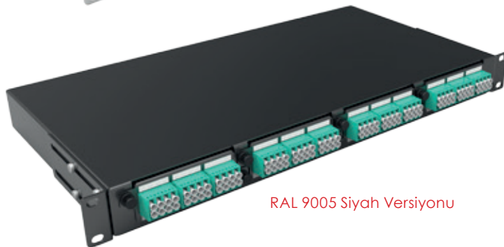
RAL 9005 Siyah Versiyonu