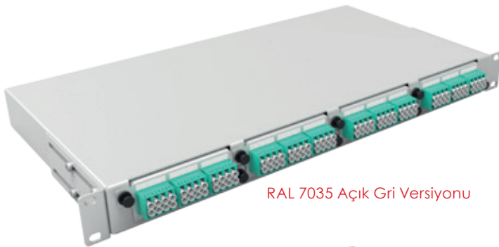
RAL 7035 Açık Gri Versiyonu