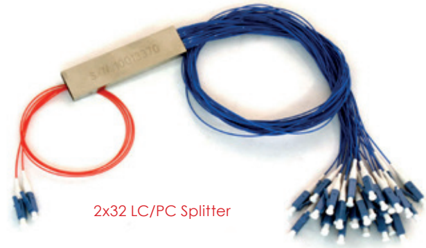
2x32 LC/PC Splitter

FTTX şebekeleri, Telekomünikasyon şebekeleri, CATV uygulamaları, Ağ izleme